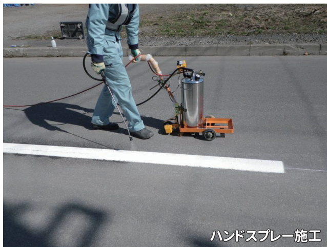
ハンスプレー施工

*夏季(気温30℃)、冬季(気温7℃)のフィールド試験の結果であり、乾燥硬化時間を保証するものではありません。