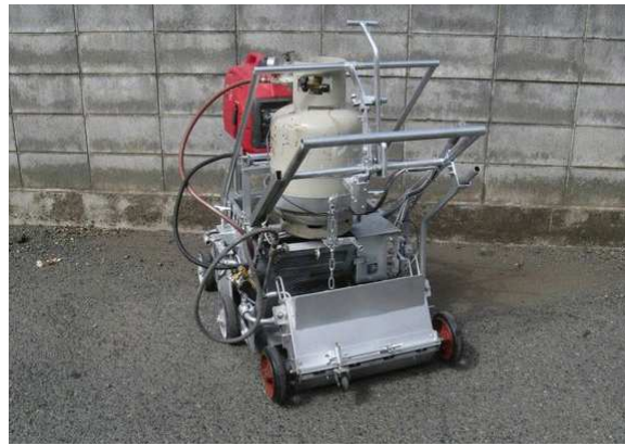
30～45cm幅 小型専用施工機