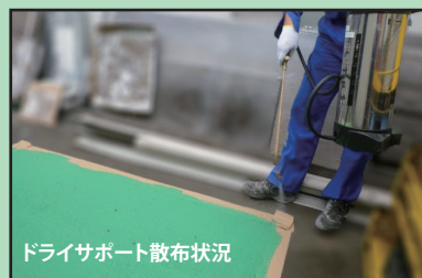
ドライサポート散布状況