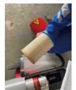
シリンダーフィルター 25時間ごと