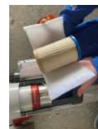
プレフィルター& シリンダーフィルター