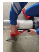
ナイロンメッシュフィルター 100時間ごと