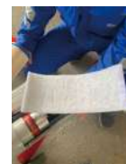
プレフィルター 2.5時間ごと