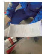
プレフィルター 2.5時間ごと