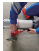
ナイロンメッシュフィルター 100時間ごと