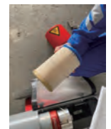
シリンダーフィルター 25時間ごと