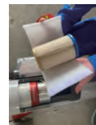
プレフィルター& シリンダーフィルター