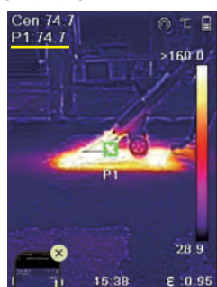
ロードドライヤー 74.7℃