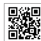
雪氷路面での作業例