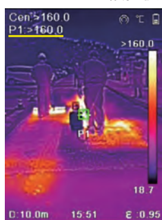
ガスバーナー 160℃以上