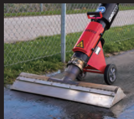
オプションノズルで より広い面積の路面乾燥