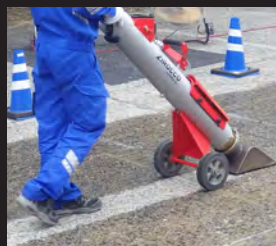
防水施工の下地処理